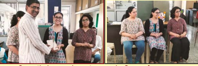
विद्यार्थी संपादक मंडळातील गुणवंत विद्यार्थ्यांचा सत्कार