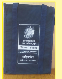
'जिज्ञासा ग्रंथालय' पुस्तक सूची व स्पर्धा