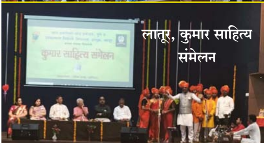
लातूर, कुमार साहित्य संमेलन