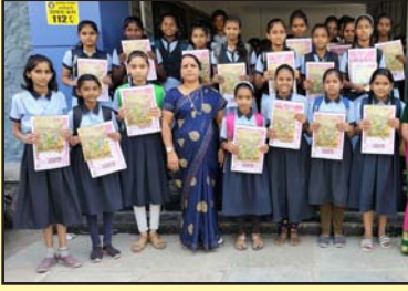
गावोगावच्या शाळांमधील विद्यार्थ्यांना अंक व दिनदर्शिका मिळाल्याचा झालेला आनंद