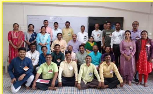
प्रबोधन दूत निवासी शिबिर, निगडी

वर्ग ग्रंथालय योजना, जिज्ञासा ग्रंथालय योजना, वर्गोद्दिष्ट स्पर्धा, प्रगतीला बक्षीस स्पर्धा यांचे तपशील पाहण्यासाठी येथे क्लिक करा.