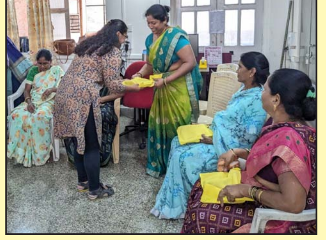
सेवक वर्गाला भेट