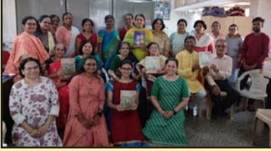
दिवाळी अंक प्रकाशन